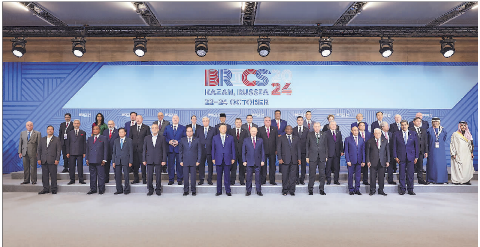
当地时间10月24日上午，国家主席习近平在喀山会展中心出席“金砖+”领导人对话会并发表题为《汇聚“全球南方”磅礴力量 共同推动构建人类命运共同体》的重要讲话。这是出席对话会的金砖国家及嘉宾国领导人或代表、国际组织负责人集体合影。