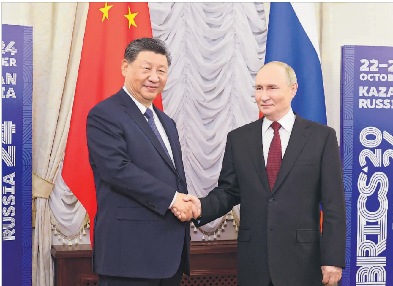
当地时间10月22日下午，国家主席习近平在喀山克里姆林宫同俄罗斯总统普京举行会晤。

俄中建交75周年。75年来，俄中已经发展成为新时代全面战略协作伙伴，两国关系保持高水平发展，树立了新型大国关系的典范。俄中合作基于平等、相互尊重和互利互惠。在双方共同努力下，目前两国各领域务实合作持续推进，俄中文化年各项活动顺利举办。俄方希望同中方进一步深化合作，助力两